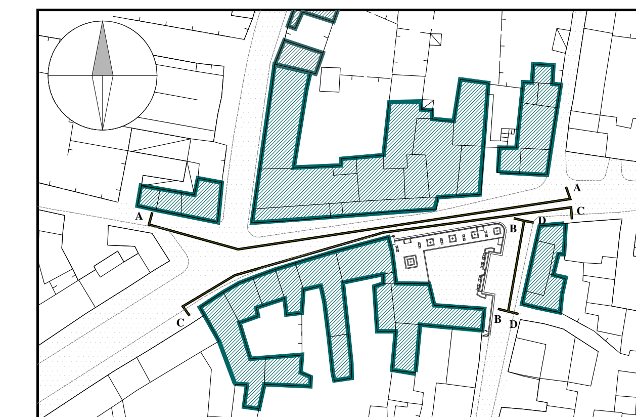
STRALCIO PLANIMETRICO SCALA 1:1000