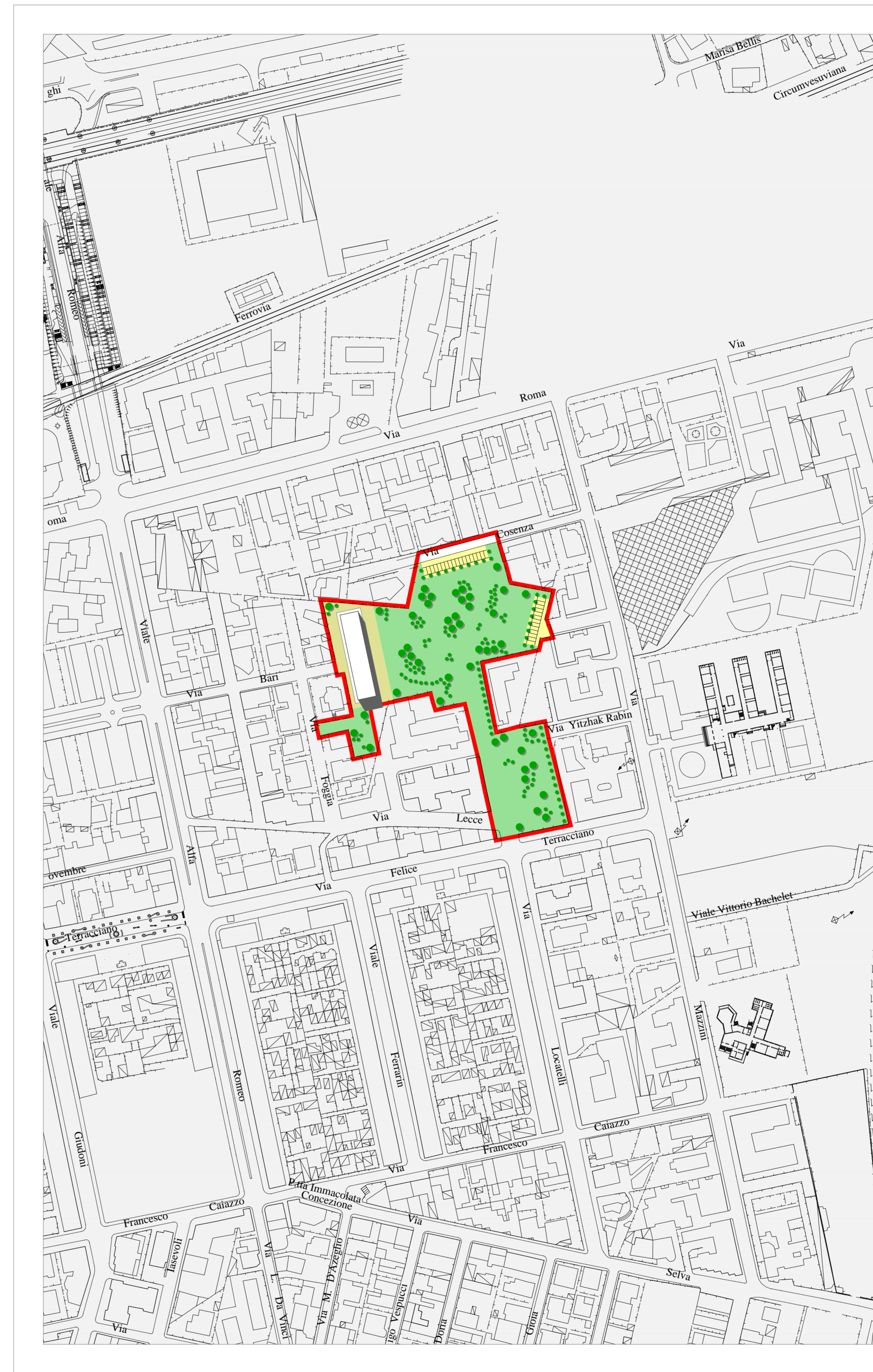
PROGETTO COMPARTO scala 1:2.000

SUP. TERRITORIALE LORDA = 26.654 mq. SUL C/1 = 3.682,50 mq. VERDE PUBBLICO = 10.287,79 mq. ISTRUZIONE INTERESSE COMUNE = 9.794,57 mq. PARCHEGGI = 1.193,18 mq.