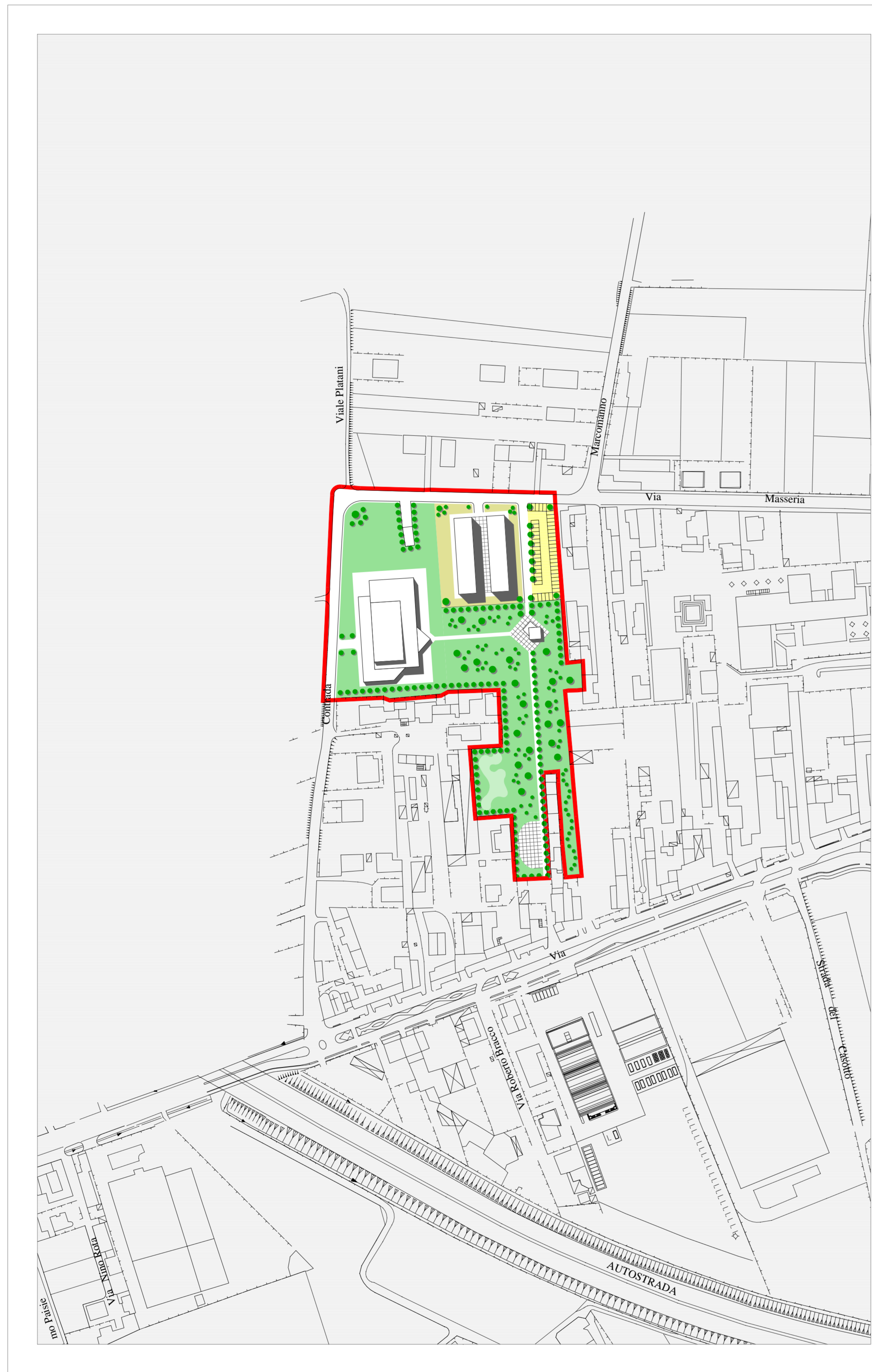
PROGETTO COMPARTO scala 1:2.000